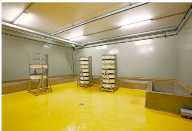
Boden-, Wand- und Salzbad-Beschichtung