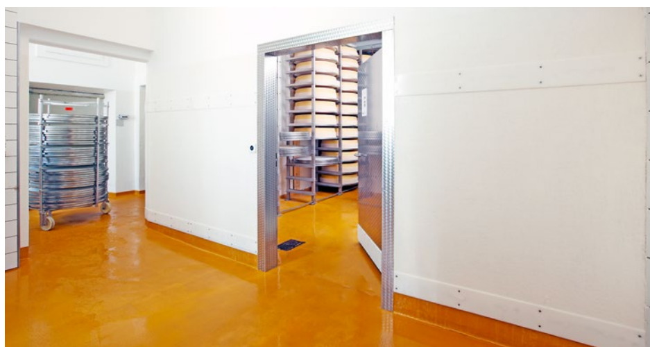
Wandbelag in Produktion